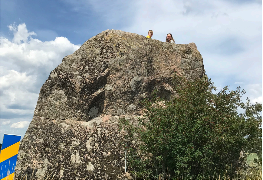
Närkes Mount Everest

Vad kul det vore att få veta hur denna handbok har inspirerat dig! Hör gärna av dig! Det enklaste är att mejla Kalle på kalle@sarbarhetsdepartementet.se eller gå till www.sarbarhetsdepartementet.se/kontakt