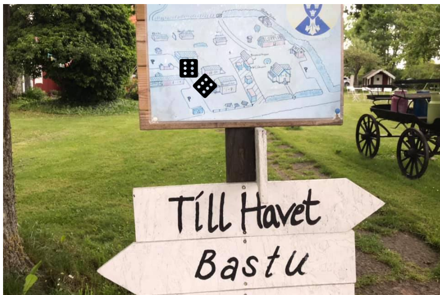
Svårt val på STF Hagaby på Öland

på Ölands norra del. Mannen i receptionen tyckte slumpsemester lät kul och berättade om när han brukade lifta till Tyskland. Han hade dessutom en kompis som brukade lifta med husvagn (för att klargöra, kompisen hade bara husvagn, ingen dragbil alltså)! Han hade inga problem att åka runt i hela Europa. Var det bättre förr eller?