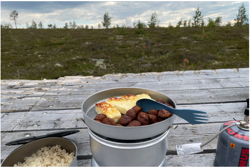
Middag uppe på Hundfjället 2024

Ha med någon form av möjlighet att ordna med mat — för oss har det varit toppen med stormkök. En kylväska är också bra att ha med och gärna en som kan kopplas in såväl på 12-voltsuttag som vanligt vägguttag. Var lite försiktig att ha den inkopplad i bilen över natten, vi lyckades nämligen att ladda ur bilbatteriet helt på det sättet 2022. Det var en himla tur att det hände på en camping där det fanns vänliga människor som kunde hjälpa till.